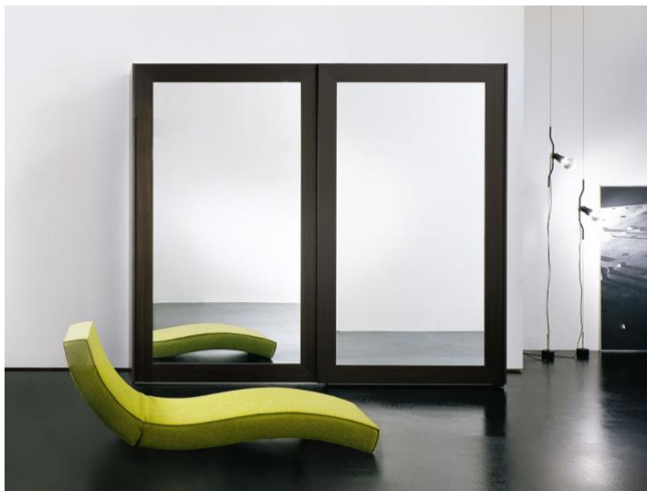
design: Pietro Arosio

La semplicità è la principale caratteristica dell'armadio Passe-Partout, che nel nome riassume la sua adattabilità agli spazi più disparati. Le ante sono sempre caratterizzate da una larga cornice perimetrale con taglio a 45° negli angoli che racchiude uno specchio o un pannello disponibile in diverse finiture.