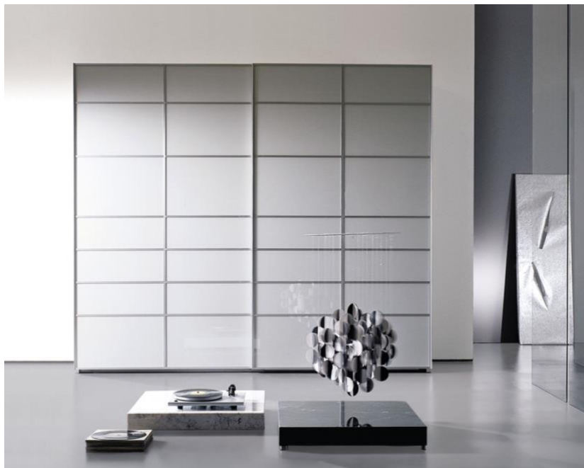
design: Pietro Arosio

Armadio caratterizzato da ante scorrevoli composte da pannelli in cristallo lucido, verniciato nei nostri colori di serie. I pannelli in cristallo sono incorniciati da una griglia di alluminio anodizzato naturale, leggera e perfettamente in armonia.