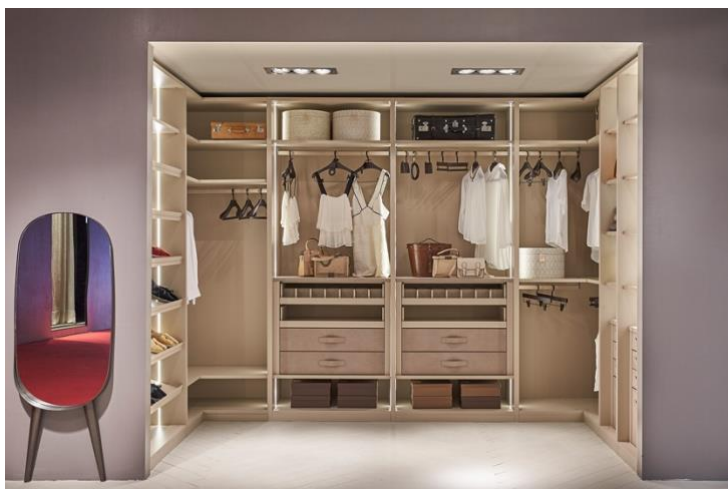
design: Pietro Arosio